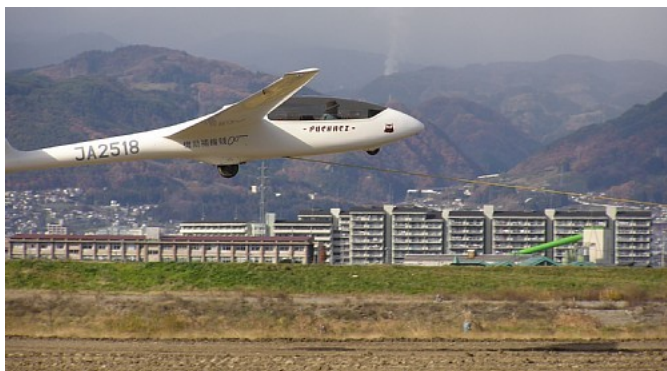
ウインチ曳航で離陸するSZD-50-3 プハッチ

SZD50-3 プハッチ複座滑空機 2機 (JA2518・JA2540) SZD51-1 ジュニア 単座滑空機 (JA2524) SF25 ファルケ 複座動力滑空機 (JA2338・曳航可能機) TOST 式010型 2連ウインチ 長野式 2連ウインチ その他、無線局やトレーラー牽引用自動車など、 運航に必要な機材一式