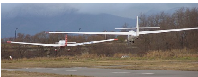
ロータックスファルケによる航空機曳航