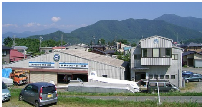
格納庫(左)とクラブハウス(右)

長野市グライダー協会では、初心者教育から、アルプス クロスカントリーフライトまで、ベテランスタッフが親切にサポート致します。